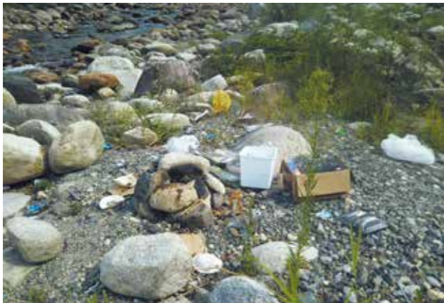
アウトドアレジャーで放置されたごみ

また、近年、来訪者が増加している奥永源寺地域の河川区域においては、バーベキューなどのごみが放置されている状況が散見されることから、地域の自治会や観光事業者、警察、滋賀県、庁内関係課などで奥永源寺地域アウトドアライフ推進協議会を設立し、不法投棄されたごみの回収や河川利用に関する注