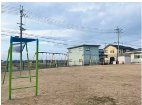
安全安心に過ごせる環境を