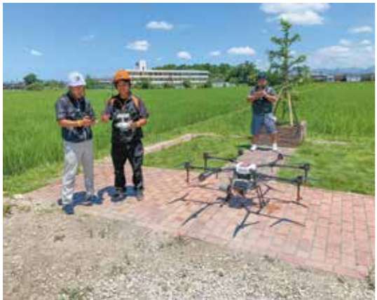
スマート農業化に向けて

A この戦略は本市としても取り組みを強化すべき重要課題と考えています。今後イノベーションによって開発される技術を積極的に取り入れ、温室効果ガスの削減や環境負荷の軽減などによって、災害や気候変動に強い持続可能な農林水産業を目指していきたいと考えています。