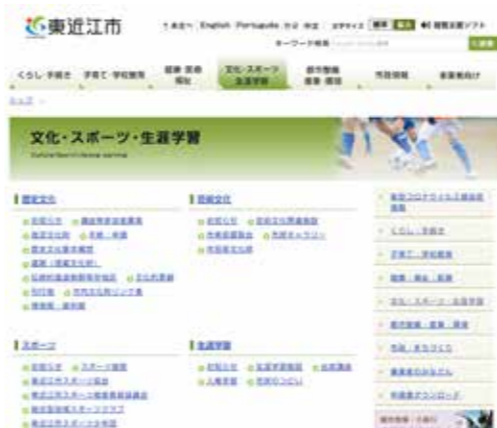
新たに『芸術文化』が追加された市HP

②市ホームページの「歴史文化」「スポーツ」「生涯学習」というカテゴリー分けは、市民の皆さまに分かりやすく分類したもので、歴史文化には当然、芸術文化も含まれています。