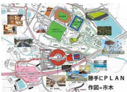
こんな施設ができればいいのに・・・