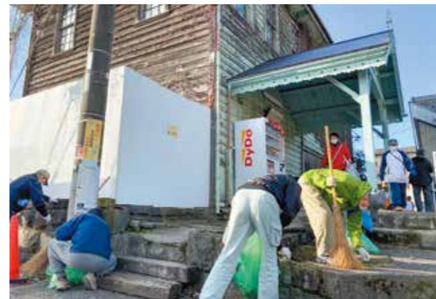
地元住民による新八日市駅の清掃

Q 近江鉄道を軸とした地域公共交通政策に取り組むためのマスタープラン「近江鉄道沿線地域公共交通計画」が策定されたが、 ①市は近江鉄道の駅および周辺の整備に関してどのような働きかけをしているか。また、市が主体となって整備された例と、今後整備が必要だと思われる駅関連設備や周辺施設は。 ②「マイステーション・マイルール」の意識が高まる中、応援いただける皆さんと近江鉄道株式会社に対し、市はどのように関わり、役割を果たそうと考えているのか。 A ①本市では乗客が便利で快適に利用できるよう常に改善の申し入れを行っています。 しかし遅々として進まないため、市が国や県の補助制度を活用しながら桜川駅のトイレや太郎坊宮前駅の周辺整備を行ってきました。 今後は、トイレや駐輪場など、