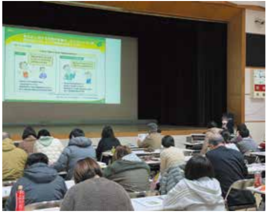
認知症キャラバン・メイト養成研修の様子

②本人や家族が早期に医療機関や地域包括支援センターなどに相談できることが重要であり、コロナ禍で相談や受診の遅れが危惧され、支所を含めた地域包括支援センターの相談窓口やもの忘れ相談室の周知を強化しています。また、かかりつけ医や認知症疾患医療センターとの連携を充実し、初期集中支援体制の強化を図っています。