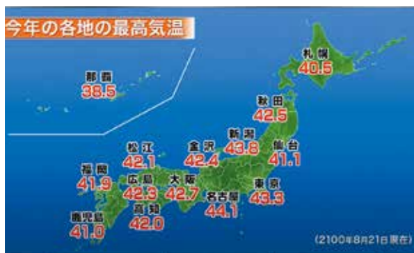
環境省の「2100年度夏の天気予報」動画より

Q 世界で異常な豪雨、台風、猛暑など気候危機が進行している。環境省は温暖化防止対策を何もしないと、2100年には最高気温は44.9度に達し、最大瞬間風速90メートルの巨大台風が日本を襲うと訴えている。11月に開催されたコップ26は、「2050年までに気温上昇を産業革命時比で1.5度に抑えるために、2030年までに二酸化炭素の排出を45%削減」で合意した。今、ゼロカーボンシティ(二酸化炭素排出実質ゼロ)宣言をした自治体は、2年前の9自治体から479自治体へと急増している。 ①本市もゼロカーボンシティ宣言をすべきでは。 ②本市の2030年目標はコップ26より高いが進捗度の把握は。 ③平成22年度のエネルギー購入での市外流出資金332億円を補うためには従来の取り組みとともに、風力や水力など、自然