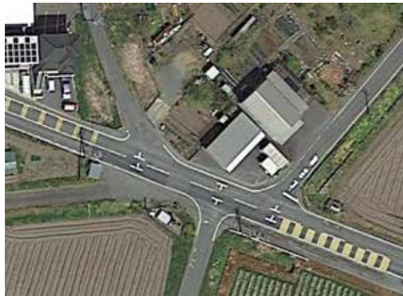
東市辺にある変則6差路の停留所

Q 市内における公共交通空白地をなくすことを目的に運用されているちよこつとバス、タクシーについて、 ①停留所の位置は、どのような観点から設置されているか。 ②運転免許証の自主返納が進む中、公共交通の将来像は。 A ①停留所は自治会中心部からおおむね300メートル圏内に1カ所を基準にしています。自治会からの要望や安全性、利便性を考慮して設置しています。バス、タクシーそれぞれに停留所を設けることも可能です。②運行には多額の財政負担を伴いますが、市民の移動手段を確保するための重要な都市インフラとして将来にわたり維持していかねければならないと認識しています。