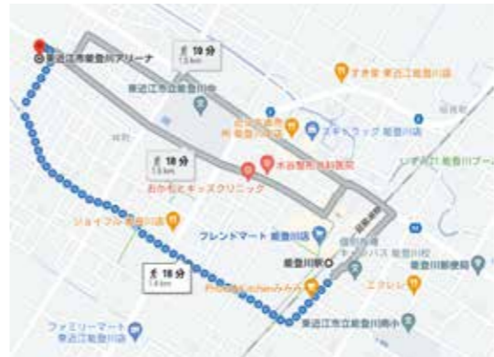
「能登川駅から能登川アリーナまで」と検索するとこのように経路案内がされる。(Google マップより)

Q 「J・R能登川駅から能登川アリーナまでは直線道路1本なのになぜか遠回りしている高校