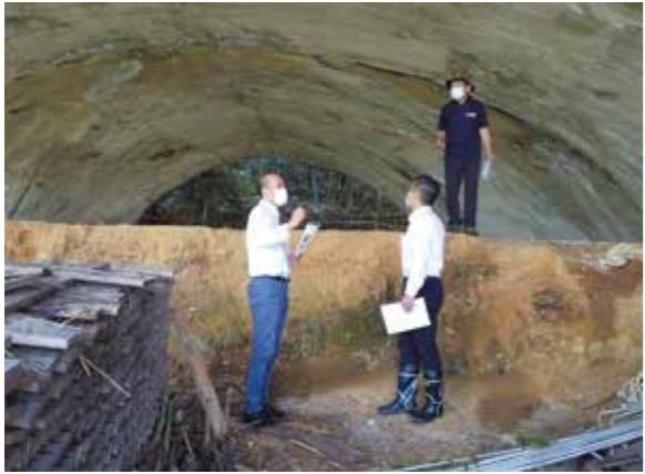
布引丘陵に残る掩体壕

A ①高層マンションの建設やシェアハウスの検討など居住空間の創出、住宅取得への支援、