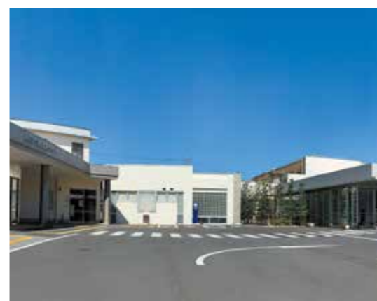
がん診療棟が新設された蒲生医療センター

Q 新型コロナウイルス感染症で明らかになった医療従事者の偏在や不足、平時や感染症を含む災害時の病床確保、在宅療養や高度医療支援、デジタル化・広域化、人材育成などこれからの地域医療再生に向けた体制整備について、 ①滋賀医大に対して行っている総合内科・外科医や家庭医養成の寄附講座などを通じた地域医療再生のビジョンは。 ②東近江圏域で地域医療連携推進法人の設立を進めているが、現在の進捗状況は。 ③地域医療連携推進法人を地域での連携協約や協議会、機構・法人の共同設置などの広域行政化に発展、進化させる考えは。 A ①医師確保は重要な課題であり、寄附講座などの維持による医師の育成と併せて、市民が良質な医療が受けられる地域医療体制を確保します。②可能な限り早く一般社団法人を設立するため、まずは、設立