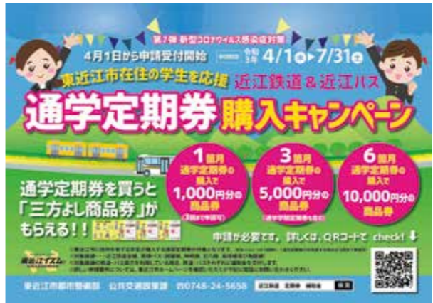
昨年実施されたキャンペーン

A ①令和2年7月時点での定期券利用者数2018人のうち、通勤定期利用者数は484人、大学生や専門学生も含めた通学定期利用者数は1534人です。