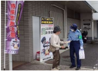
▲滋賀銀行での啓発活動の様子