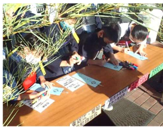
▲短冊に願いを書く隊員たち 啓発活動の様子▶