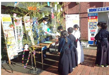
▲任命書を受け取る隊員たち

その後、「犯罪に気を付けてください。」と声をかけながら来店者に啓発チラシなどを配布しました。