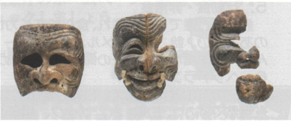
文化8年の火災で焼損した翁、三番叟、父尉の3面(左から)

中期に制作された悪霊退散役の猿田彦(さるたひこ)の面で、重厚な趣をよく残している。その他の 6 面については江戸時代以降の作例である。