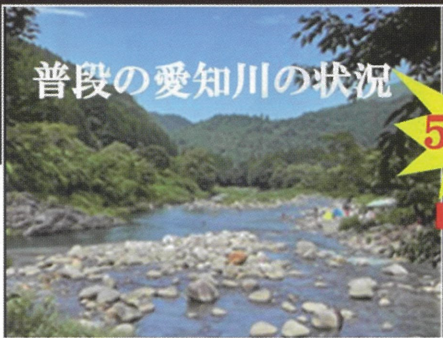
普段の愛知川の状況

今年の8月に局所的な大雨により愛知川及び神崎川が急激に増水し愛知川では親子3名が中州に取り残され、神崎川ではシャワークライミングをしていた50名が中州に取り残される水難事故が発生しました。その翌月にはキャンプ場に来ていた男女2名が河川に流される事故が発生しており、十分な注意が必要です。