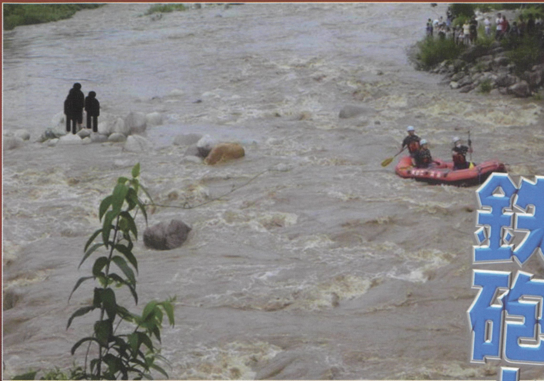
水難事故の現場 消防がボートで救助

今年の8月に局所的な大雨により愛知川及び神崎川が急激に増水し愛知川では親子3名が中州に取り残され、神崎川ではシャワークライミングをしていた50名が中州に取り残される水難事故が発生しました。その翌月にはキャンプ場に来ていた男女2名が河川に流される事故が発生しており、十分な注意が必要です。