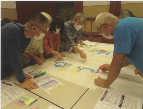
どのグループも机に身を乗り出し、矢継ぎ早に来る難題を解決しようと熱心に話し合われました。