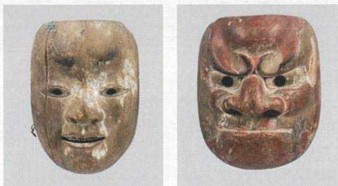
若い男(右)と癡見(左)の面

筒井神社には、若い男と癡見(べしみ)の2面の能面が伝来する。何れも古様で我が国の能面史上貴重な作例である。木地師と縁の深い同社に古様な能面が伝来することは注目すべき点であり、同社における演能文化の一端を伝える資料として貴重である。(室町時代末期～桃山時代)