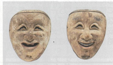
翁(左)と延命冠者(右)の面

大皇器地祖神社には 6 面の能面が伝来する。この内、翁/白色尉(おきな/はくしきじょう)、三番叟/黒色尉(さんばそう/くろしきじょう)、父尉(ちちのじょう)、延命冠者(えんめいかじや)が揃っていることから、当地では少なくとも室町後期には国土安穩・五穀豊穡を祈る神事が催されていたことが推測される。翁、三番叟はその後追加されたことが知られている。これらの能面は、当地での演能文化の一端を示す資料として貴重である。(室町時代後期～江戸時代中期)