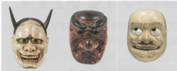
左から般若 (はんじゃ)、鼻高 (はなだか)、賢徳 (けんたく) の3面 (八幡神社所有)