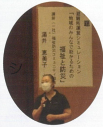
避難所運営を シミュレーション

9月3日、永源寺コミュニティセンターで第2回コミュニティ防災講座が開催されました。