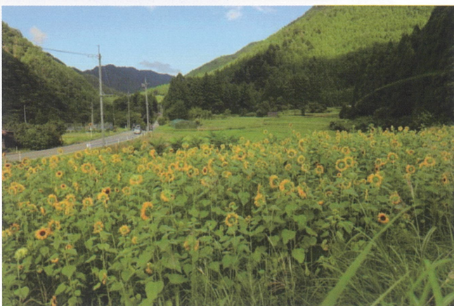
神崎橋手前の農地を活用した満開のひまわり畑