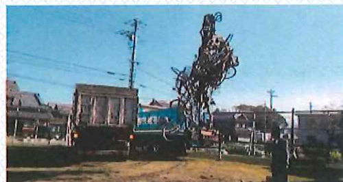
林田町多目的広場