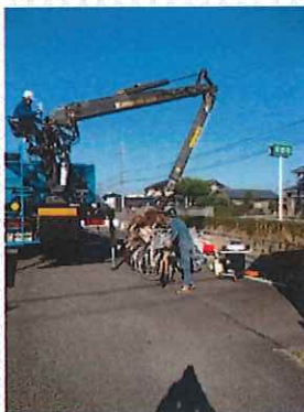
御園町自治会館前