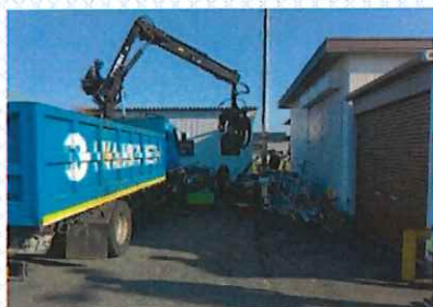
御園コミュニティセンター駐車場