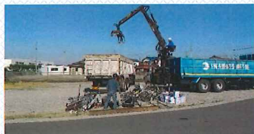
勝見グラウンド横