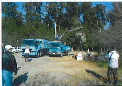
若松天神社東森広場(布引焼隣り)