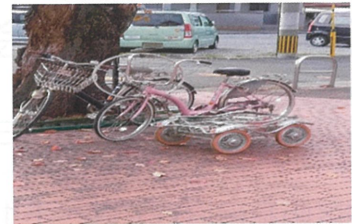
春日町・幸町自治会