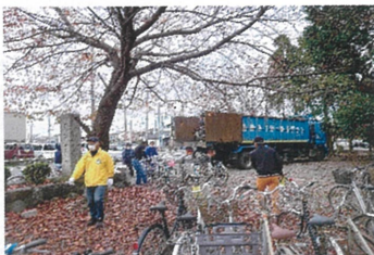
ひばり1・2・3・4自治会

11月26日(土)大型金属資源の回収が各自治会にて行われました。早朝より皆様のご協力ありがとうございました。役員の皆様ご苦労様でした。今年度の回収は、3,860kgでした。