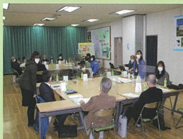
2つのグループで行われる懇談の様様

① “誰もが安心して暮らせる地域福祉のまちづくり”を目指して一緒に考えたり、話したりする場づくり。