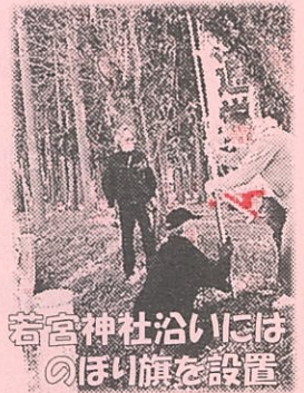
若宮神社浴衣には のぼり旗を設置