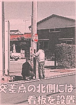
交差点の北側には 看板を設置

ドライバー1人ひとりが交通ルールを守り、通学路や横断歩道の周辺は速度を落とす等、思いやり運転で、事故のない地域を作っていきましょう。