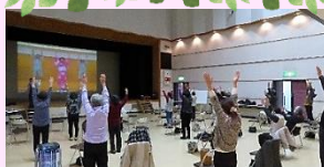
R3年度 わいわいサロン