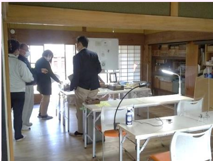
【一般社団法人がもう夢工房】

がいばん楽校は今後、①近江商人の精神、堀井新治郎の歴史を学ぶ企業研修、②不登校児・生徒向けフリースクール、③各種団体（個人も）向け貸し室、などを中心に活用する計画です。ご期待ください。