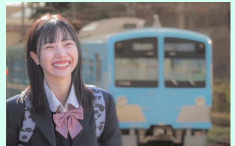
【近江鉄道映画製作実行委員会】