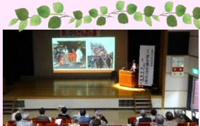
R3年度 あいがもけんぶん塾