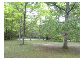
蒲生地区まちづくり協議会(広報企画委員会)