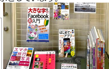
ラインやフェイスブック、LINEやFacebook、スマホで撮る写真の本などご紹介しています!