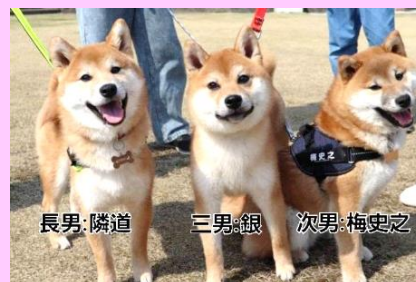
長男:隣道 三男:銀 次男:梅史之

長男の隣道です。僕の弟たちは、それぞれ新しい飼い主さんのところで可愛がってもらっているよ！みんな愛東に住んでいるから、たまに集合すると激しいじゃれ合いがはじまるんだ！結果、僕がマウントとるけどね