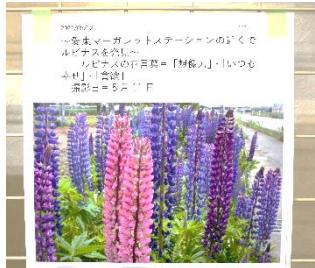
カラフルなルピナスの花。花言葉も添えられています。