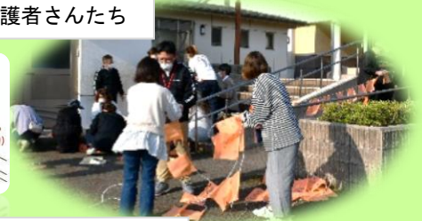
旗には子どもたちのメッセージが寄せられています。