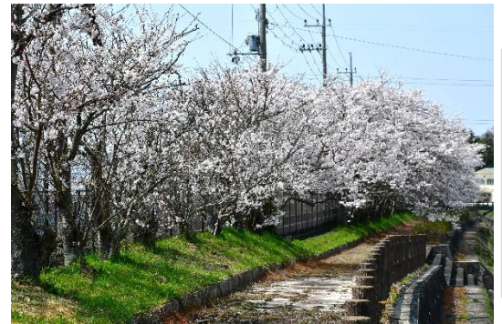
今春の経田川の風景