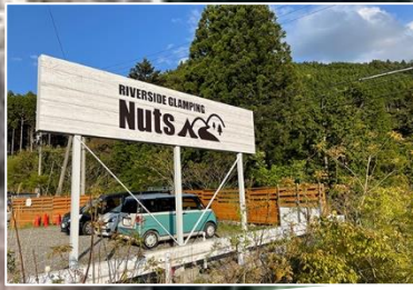
R421 沿いのこの看板が 目印です↑↑