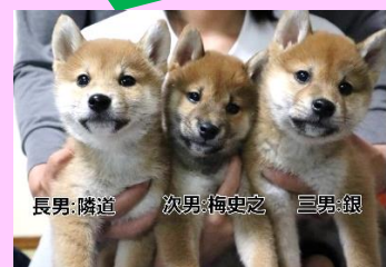
長男:隣道 次男:梅史之 三男:銀

長男の隣道です。僕の弟たちは、それぞれ新しい飼い主さんのところで可愛がってもらっているよ！みんな愛東に住んでいるから、たまに集合すると激しいじゃれ合いがはじまるんだ！結果、僕がマウントとるけどね