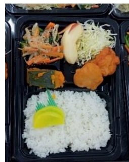
前回の「お弁当」写真です

愛東地区社会福祉協議会は、毎月1 回、愛東地区内の一人暮らしの高齢者 や重度の障がいをお持ちの方、また母 子・父子のご家庭などに見守りやふれ あい、安否確認等を兼ねて「お弁当」 をお届けする給食サービスを実施し ています。 この事業は毎月、愛東赤十字奉仕団 の役員さんが、心のこもったお弁当を 調理され、民生・児童委員さんが対象 の方(約40名)にお届けいただくなど、 日赤さんや民生委員さんのご協力で 成り立っています。6月のお弁当に は、人気の地元特産、愛東メロンが添 えられる予定です。甘い香りが漂い、 いっそう華やかさをましてくるこ とでしょう。