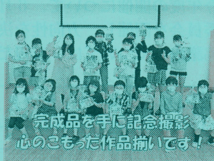
完成品を手に記念撮影 心のこもった作品揃いです!