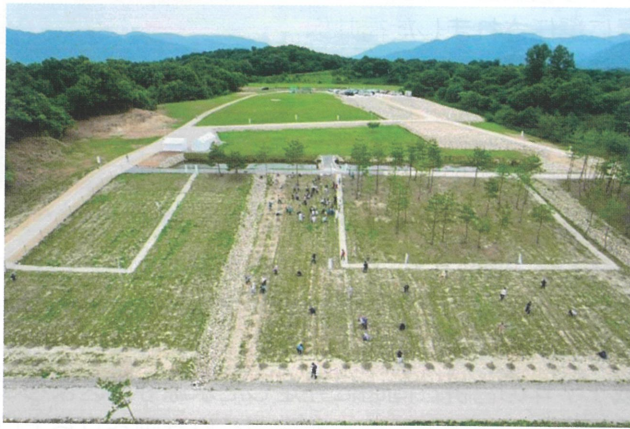
きれいに整備された市原にこにこの森。植樹場所は写真手前。一日だけの森のどうぶつえんも開園されました。

滋賀県で47年ぶりの開催となった全国植樹祭が、6月5日、甲賀市の鹿深夢の森を主会場に滋賀県内各地の会場で行われました。 招待者が記念植樹される会場のひとつに選定された「市原にこにこの森」では、全国規模のこの行事を地域でも盛り上げようと、この日の午後、地域住民ら約150人が参加してイロハモミジやハンノキなどの苗の植樹が行われました。 記念植樹会場に選ばれた後、2年越しで会場が整備され、初めて訪れた方は、約5ヘクタールもある森の広さにびっくり。