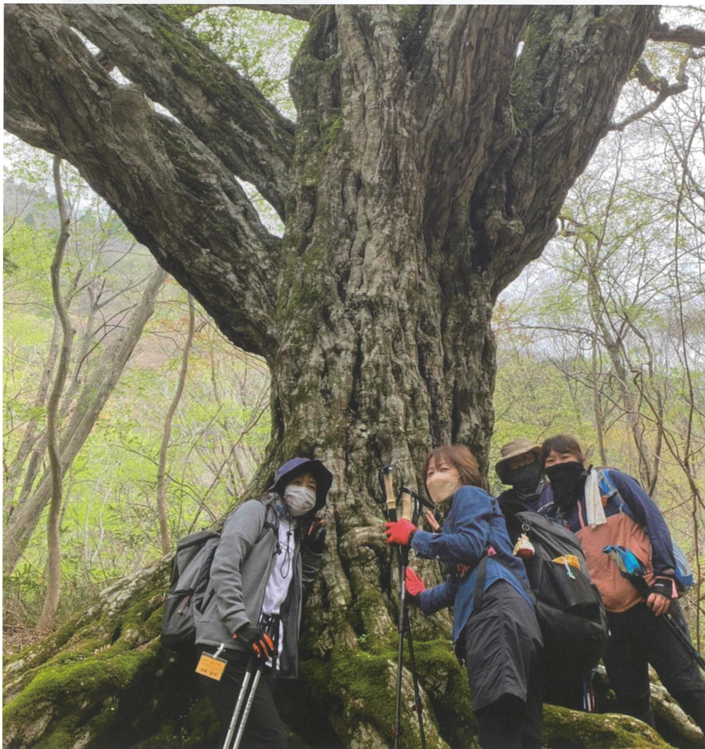
千草街道を往く 4月23日 歴史を凝縮、存在感あるアカシデからパワーもらって