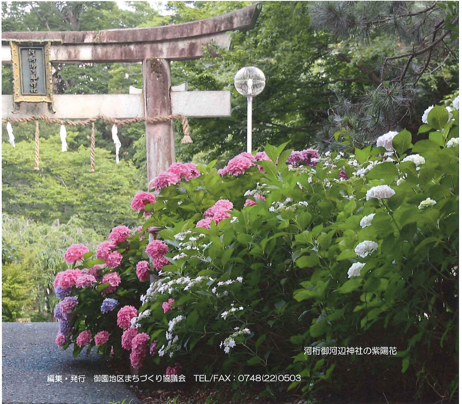
河桁御河辺神社の紫陽花

編集・発行 御園地区まちづくり協議会 TEL/FAX : 0748(22)0503