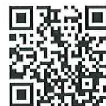
みそのいいね！ 御園地区まちづくり活動紹介