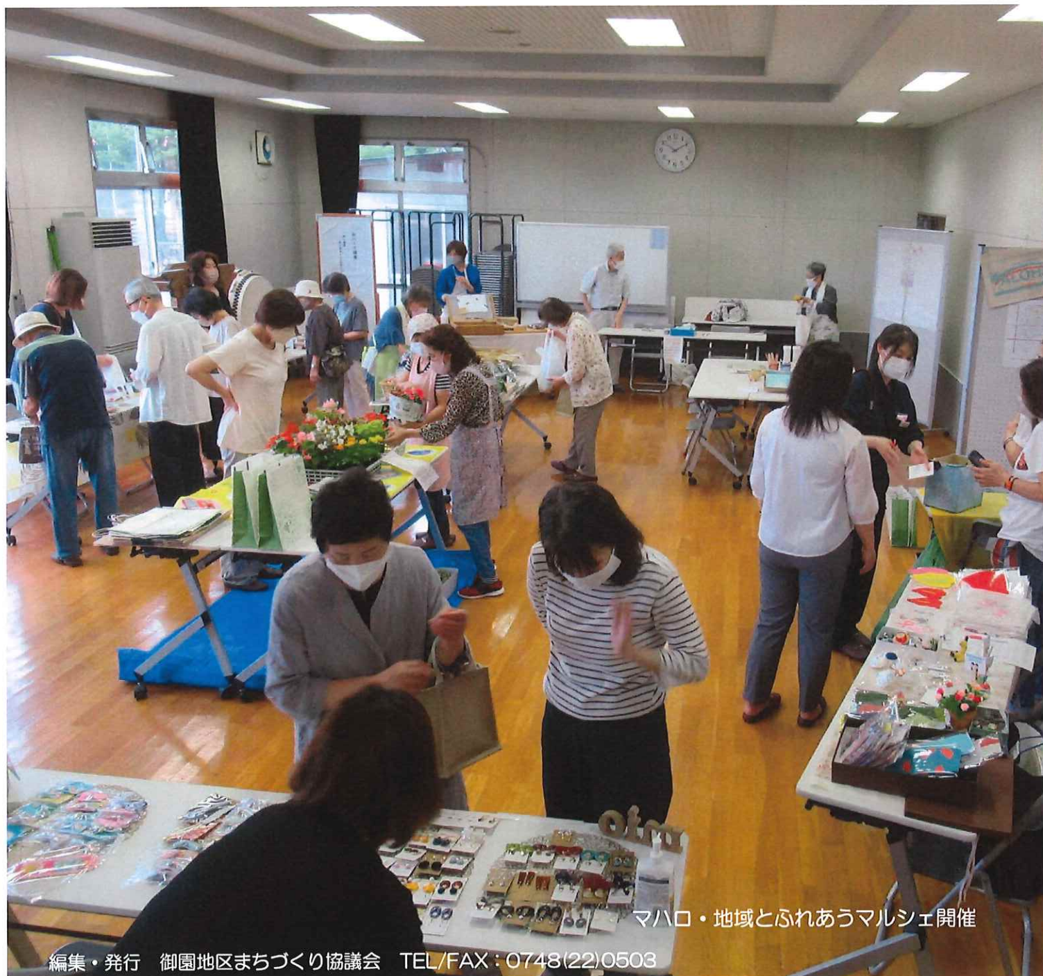
マハロ・地域とふれあうマルシェ開催