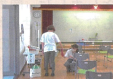
握力等の体力測定