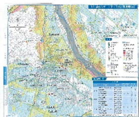
市「ハザードマップ」

8月5日(金)自治会連合会の定例会にて、地域防災についてのお話をしました。南部地区は、幸いなことに大きな災害もなく暮らせる地域ですが、それでも災害への備えは必要です。そのため自治会長の皆さんに緊急時の避難所や防災体制について、また各町の防災委員を対象にした研修会の開催についてお願いをしました。