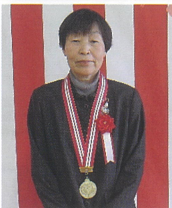
大田初代様 (林田町)