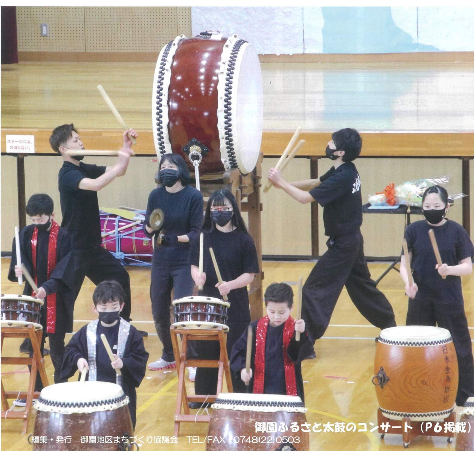
御園ふるさと太鼓のコンサート (P6掲載)