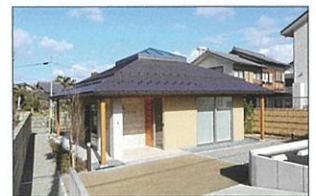
五峰興風館 (佐野町23番地)

財団では、財団事務所「五峰興風館」の展示室・ホール等の施設貸与(原則無償)も行っています。詳しくは財団のホームページをご覧ください。いずれもお問い合わせは、ホームページ内のメールフォームまたはFAXにてお願いします。(URL: http://gohoukouhukai.com TEL/FAX: 0748-42-3901)