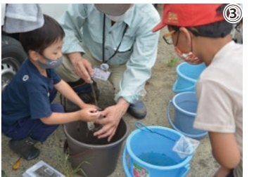
①親子で協力し、生き物を調査 ②職員の説明に真剣に聞き入る参加者 ③メダカを観察。メダカにストレスを与えないようにやさしく触ります。