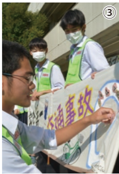
①真剣な眼差しで東近江警察署員から交通事故の現状について話を聞く生徒 ②元気な呼びかけとともに啓発物品を渡す生徒会メンバー ③大森生徒会長が校章のバッチを横断幕に付けて、次の学校へバトンタッチ