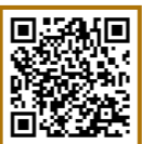
特設ホームページ