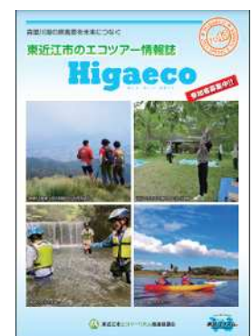
東近江市エコツーリズム推進