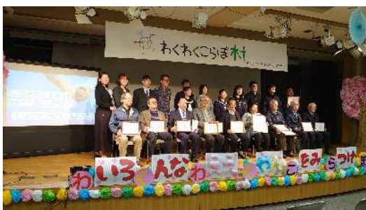
わくわくこらぼ村 わがまち協働大賞表彰式