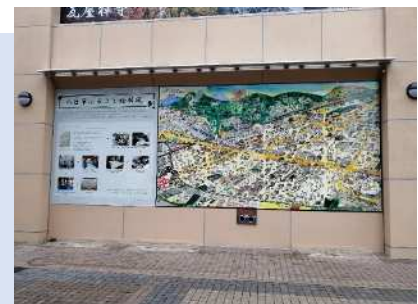
八日市ふるさと絵屏風制作 聖徳中学校と八日市高校美術部の 着色協力