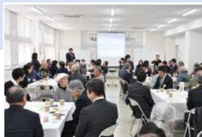
市民と議会の意見交換会 【東近江市の魅力ってなんだろう?】