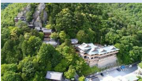
太郎坊宮(参集殿、本殿) 【ドローンによる空撮】