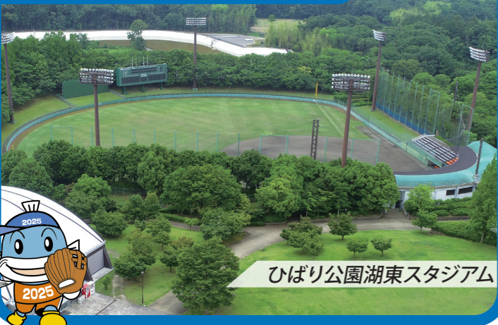
ひばり公園湖東スタジアム