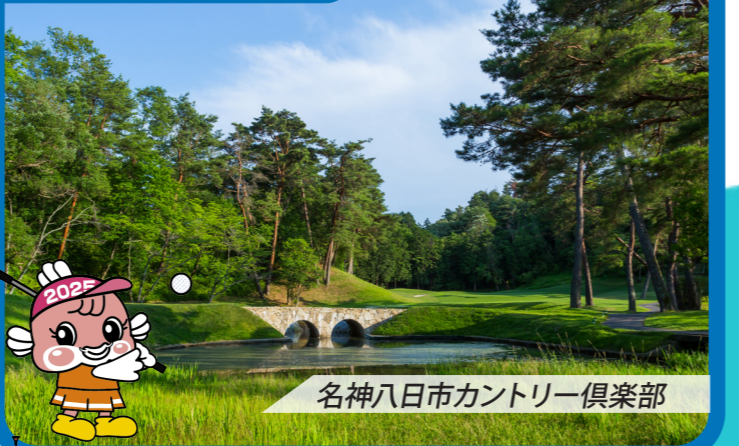
名神八日市カントリー倶楽部