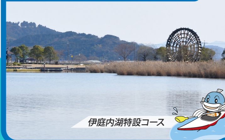
伊庭内湖特設コース