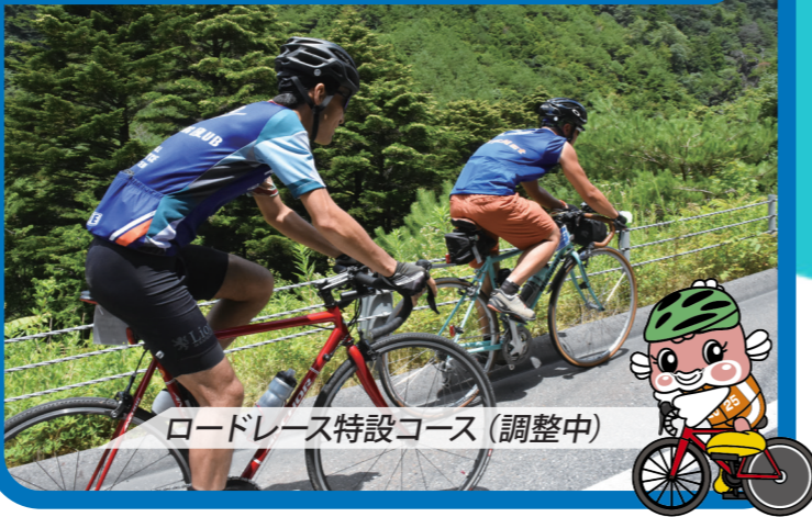
ロードレース特設コース(調整中)