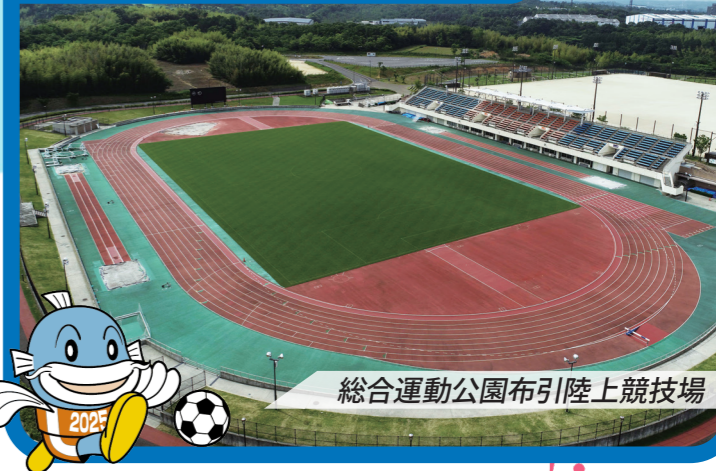
総合運動公園布引陸上競技場