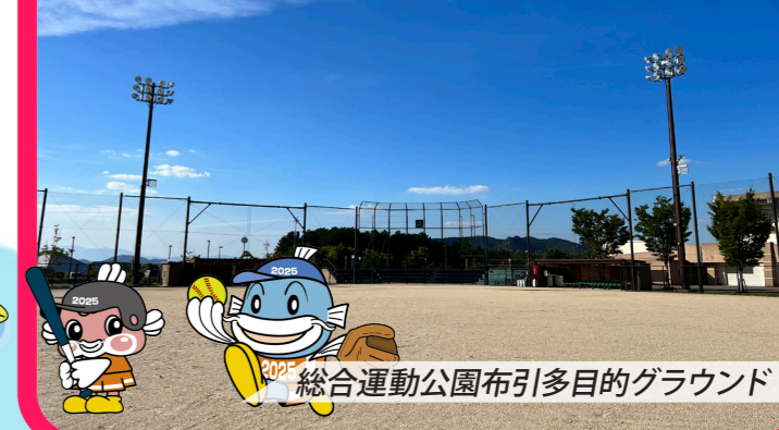
総合運動公園布引多目的グラウンド