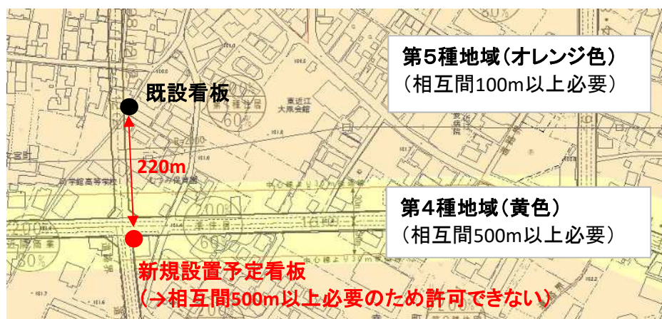
図1 同一広告主による複数の広告設置が許可できない例

景観を守る観点から、下図の例のように、 より長い相互間距離が必要な方の規制地域の基準(より厳しい規制地域の基準) が適用される。