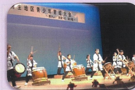
蒲生野太鼓わらべ組