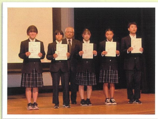
作文受賞者の皆さん

10月16日、五個荘中学校の全校生徒および当五個荘支部の役員・まちづくり協議会の有志が、地域のイベント会場となる五個荘中央公園や五個荘中学校のグラウンド周辺のごみ拾いと除草作業を行いました。共に汗を流すことで、より一層交流が深まりました。