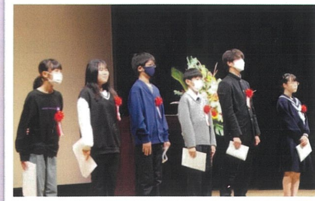
意見発表の皆さん

蒲生支部では、10月21日（土）あかね文化ホールにおいて、「蒲生地区青少年育成大会」を開催しました。蒲生地区の小・中学生6人が、家族への感謝の気持ちや将来の夢、家族の体験した戦争についての思いや考えなどを自分自身の言葉でまとめ、堂々と発表しました。ステージ発表では、蒲生野太鼓わらべ組やあかねジュニアバンドの演奏、Dance studio gato（ダンス スタジオ ガト）の可愛いキッズダンサーによるダンス等で、会場は大いに盛り上がりました。また、当日の受付や司会、大会の運営は、中学生の実行委員5人が中心に行い頼もしい姿を見せてくれました。