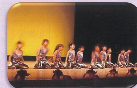
Dance studio gato