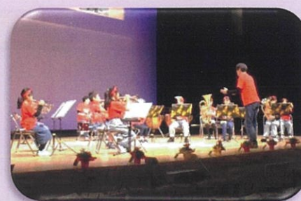
あかねジュニアバンド