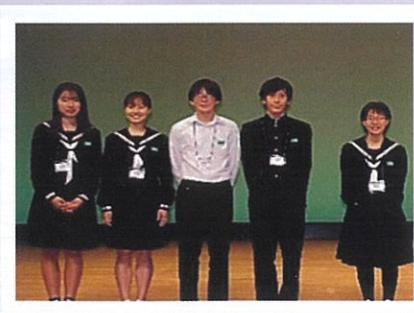
中学生実行委員の皆さん