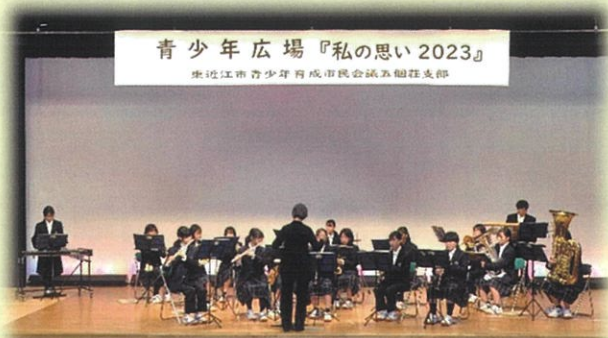
五個荘中学校吹奏楽部の美しく力強い演奏