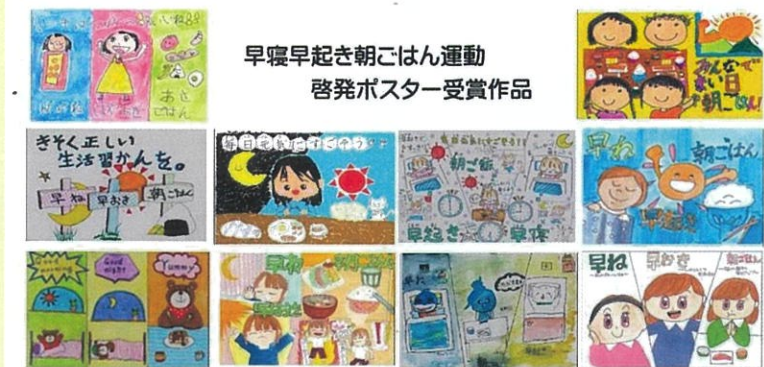
早寝早起き朝ごはん運動 啓発ポスター受賞作品

10月16日、五個荘中学校の全校生徒および当五個荘支部の役員・まちづくり協議会の有志が、地域のイベント会場となる五個荘中央公園や五個荘中学校のグラウンド周辺のごみ拾いと除草作業を行いました。共に汗を流すことで、より一層交流が深まりました。