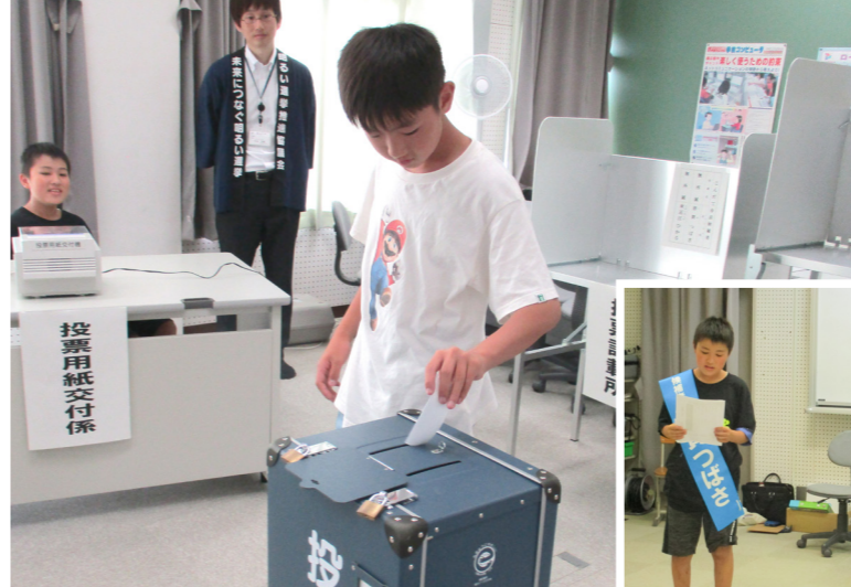
▲能登川北小学校6年生

フットパスを通して地域の魅力を伝え、地域の自然や歴史・文化、伝統などを次世代につないでいきたいです。「登山は体力的に厳しいけれど自然に触れたい」という人におすすめで、参加者の中には、ただ散歩するだけでは出会えない人との交流や新しいコミュニティを求めてくる人もいます。地元の人と一緒に歩きながら、地元の人しか知らない伝承などを聞けるのも面白いところ。私たちは、地元の人と参加者をつなぐ橋渡しの存在なのかなと思っています。まだまだ知名度が低いこのツアーですが、多くの人が東近江市の魅力に触れ、東近江市のファンになってもらえるようなツアーを目指していきます。