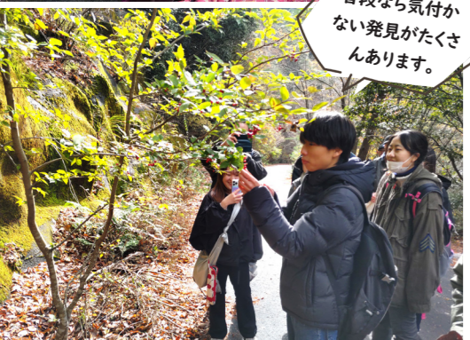
▲杠葉尾町で開催されたフットパスの様子。なるべく寄り道をして、そこにあるものを再発見します。