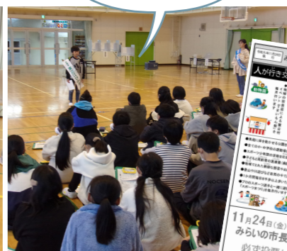
▲演説を聞き、選挙公報を見て投票先を決めます。