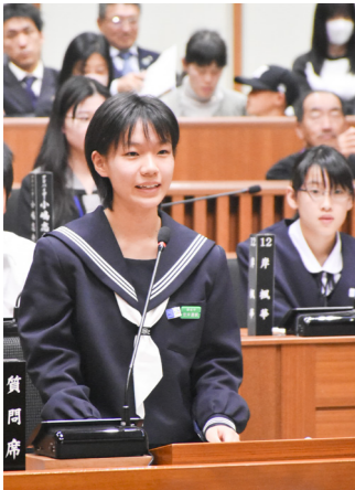
中学生議員の皆さん▼