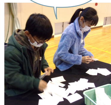
▲八日市西小学校6年生