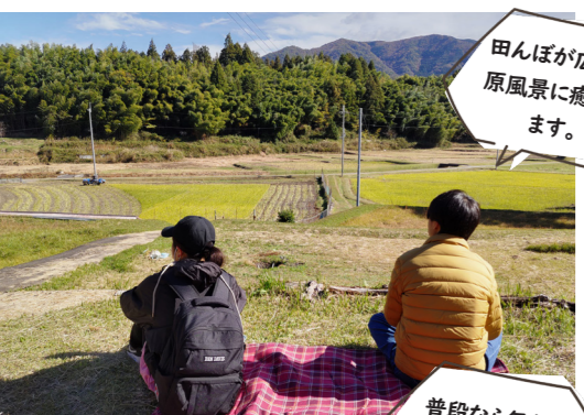
▲▼和南町で開催されたフットパスの様子。なんでもない風景からお気に入りを見つけます。