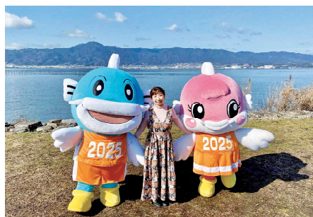
イメージソングで大会をPR

Q 本市の玄関口であるJR能登川駅を擁する能登川地区の公共交通網について、 ①令和4年3月のJR西日本のダイヤ改正で能登川駅に停車する新快速が減便されたが、能登川駅の乗降客数に変化はあったか。 ②新快速の減便は本市の発展にとり大きな痛手と思われるが、本市の見解は。 ③これ以上のJRの減便はあってはならないが、対策は。 ④ちよこっとバス大中線の利用者数が少ないように思われるが、時間帯ごとの乗車数は。 ⑤ちよこっとバス大中線の運行についての収支比率は。 A ①新型コロナウイルス感染拡大前の令和元年度と比較し、日に1300人ほどの減少です。 ②JR琵琶湖線新快速の減便は日常的に公共交通を利用して