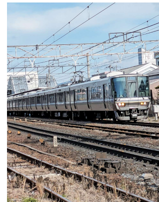
能登川駅を出発するJR新快速

民や来訪される観光客の利便性を低下させ、本市の活力低下につながりかねないと危惧しています。 ③毎年、滋賀県、県議会、市長会、市議会議長会、町村会、町村議長会の6団体の連名でダイヤの早期回復要望を行っていただいています。 ④直近3か月の乗車データでは午前中が1便当たり約3人、午後が1便当たり約2人です。 ⑤運行経費約1500万円に対し運賃収入は約1200万円、運行収支比率は8%です。