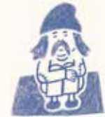
路上生活者の権利