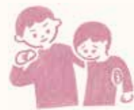
災害に伴う人権問題