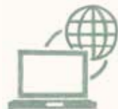
インターネットによる 人権侵害