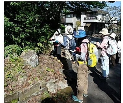
↑ 調査を行う東近江里山自然リサーチ

調査に際しては、地元の植物に詳しい者が本調査のねらいに合致した調査を行うため、新たに「東近江里山自然リサーチ」という団体を設立し、そのメンバーに里山保育実施受託者である東近江さとやまNanniesのメンバーも加わり、専門家＋市民で調査を行う体制が作られた。一般的な調査が専門家だけで完結してしまうことに比べ、本調査は植物に詳しくない市民が子ども目線で調査に加わることで、自らの知識の蓄えに加えて、子どもたちが楽しめる植物がどれほどあるかという視点で調査を行うことにも寄与できた。