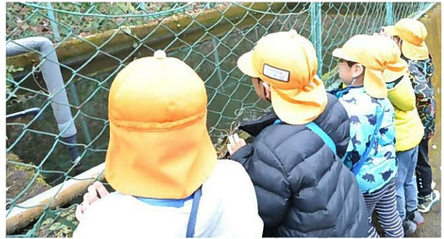
↑「何か生き物があるかな？」友達と一緒に貯水池を観察しています。