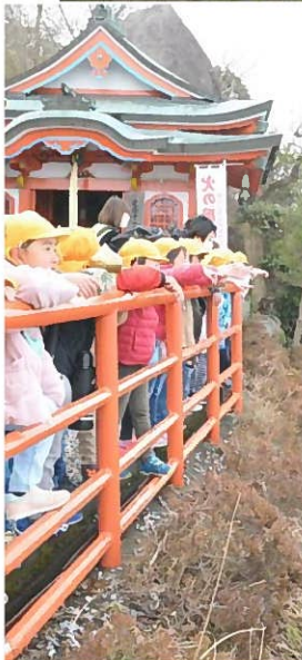
↑ 頂上からは琵琶湖や対岸の山並みまで見渡せます。