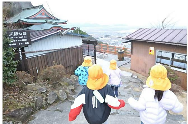
↑「やったー！着いたー！」ついに頂上に到着です！みんなの足取りが一気に軽くなります。