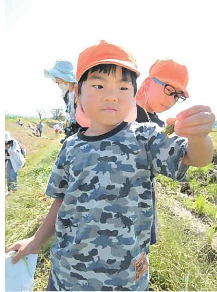
↑「バッタをつかまえた！！」 探検前のお話で「バッタの顔が仮面ライダー1号の顔に似ている」という話をしたので、つかまえた後に顔の観察をしていました。どんな顔だったかな？