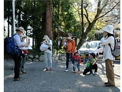
↑ 下見を行う東近江さとやまNannies

里山保育の実施を担う東近江さとやまNanniesの参加者数(会員数)については、KPI③で目標2名の増員を目指した中で、こうした活動に子育て中の女性が高い関心を寄せたことで、目標を上回る5名の参加があり、23名で活動を行うことができた。34回実施した里山保育に対して、同団体から延べ61人の参加があったが、里山保育は実施当日だけでなく事前・事後の作業も重要であり、事前の下見に延べ44人、プログラム作成に延べ34人、事後の通信作成に延べ28人が参加するなど、市職員2名で実施していたことに対してかなりの広がりが見られた。