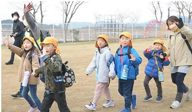
↑ 「行ってきまーす！」お見送りに手を振って元気に探検に出発です！

→ 今回の探検カード！ 山の上からの景色はどんなものだろう!? 冬の山を楽しもう！