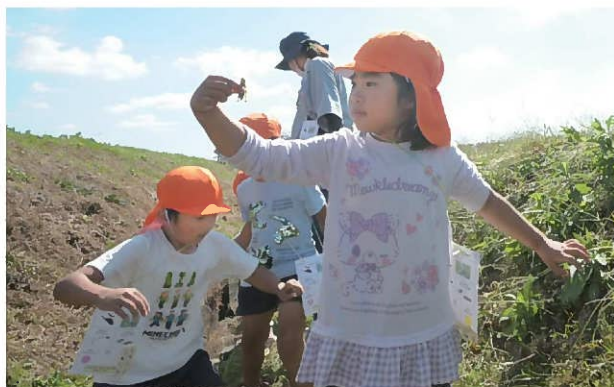
↑ショウリョウバッタより太いバッタを捕まえました！ トノサマバッタかな？ この日は、オスとメスが結婚している様子も見ることができました。