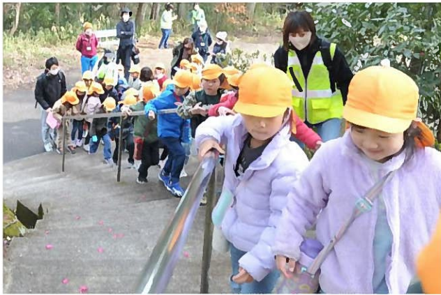
↑ さあ、あともう少し！この急な階段を登りきったらいよいよ頂上です！登っていると暑くなってくるので、自分で上着のチャックを開けて体温調整をします。