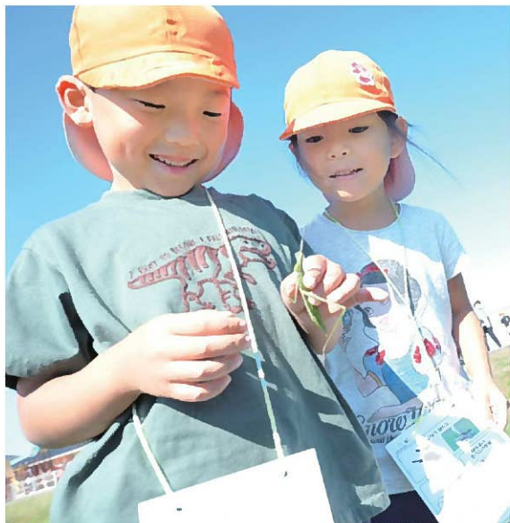
↑「バッタつかまえた！！」 暖かく、風も弱かったので、たくさん生き物を見たりつかまえたりすることができました！！