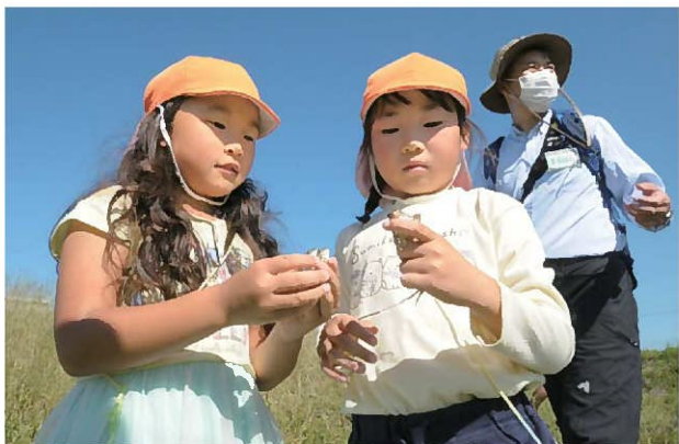
↑「大きいカエルをつかまえた！」 これは、ナゴヤダルマガエルという本州で最も少ないカエルの一つです。 トノサマガエルに似ていますが、トノサマガエルより足が短いため、ジャンプが苦手です…