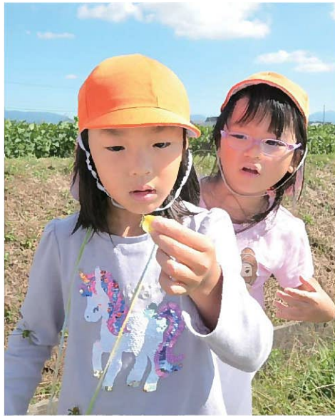
↑黄色いチョウを発見！ 本やテレビで見ると違い、本物を観察することも貴重な経験です。見た目や大きさだけでなく、鱗粉という粉が手についたり、「感触」「におい」「重さ」などいろいろなことが分かります。