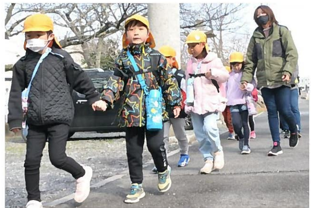
↑ 猪子山に到着！さすが5歳児さん！しっかりした足取りで約1.8kmの道のりを40分かけて歩きました。