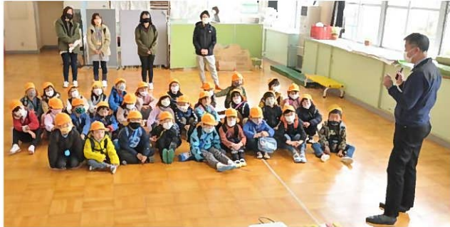
↑ 最初に探検のお話。「猪子山ではマメツタが岩にへばりついているよ」など探検のポイントや山登りの注意点についてお話をしました。

4月に伊庭内湖周辺の探検からスタートしたちどり幼稚園の里山保育も今回で、いよいよ最終回！ついに、猪子山の頂上(標高約267m)まで登ります。今回の探検は、頂上から降りながら実施しますが、まず、みんなで山頂を目指して頑張ろう！！