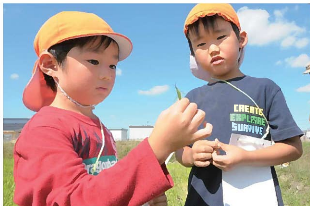
↑こちらにもバッタを発見しました。 これは、ショウリョウバッタというバッタです。春には小さかったショウリョウバッタも秋になると大きくなっています。 このように、生き物が季節の移り変わりに伴って、変化していることを知ることも大切な体験です。