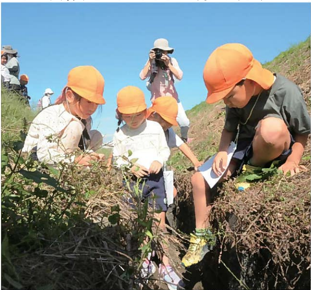
↑「あれ？どこに逃げた？」 逃げたバッタを必死に探します。 子どもの活動を撮影をしているのは、里山保育を一緒に 実施している東近江さとやまNanniesのメンバーです。