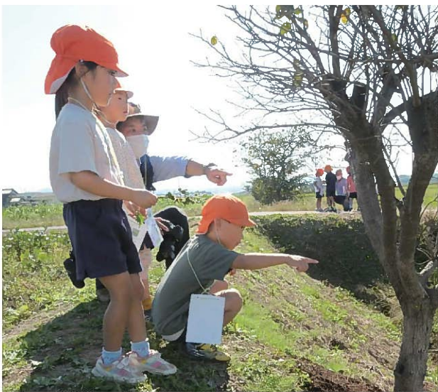
↑探検カードにある「鳥の仕業」を発見！！ 「モズのはやにえ」のことです。初めて見た人もいたようで 「うわあ！刺さっている！！」と驚いている人もいました。 スタッフも「あの辺りを見てみたら？」と発見のヒントを 出すことで探検をサポートしています。