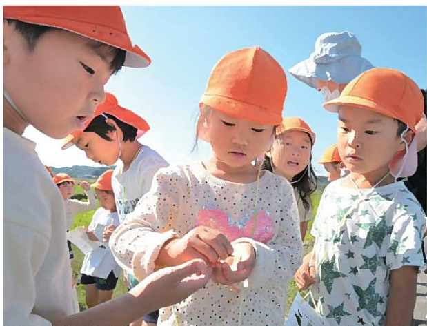
↑「つかまえた？持たせて？」「いいよ！！」 誰かが発見をして、その発見したものを友だち同士で観察することで、新たな気づきや発見につながっていきます。