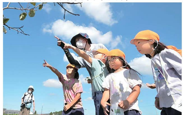
↑「はやにえが見つからへん...」「あそこにあるで！」 最初は、なかなか見つけれませんが、でも、眼が慣れて 見つかりだすと「バッタ！」「こっちはコオロギ！」と いろいろな種類の「はやにえ」が見つかりました。