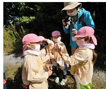
↑ 里山保育を実施する東近江さとやま Nannies