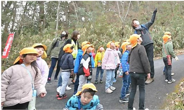
↑「あ！あんなところに！」登山途中でも声をかけあって、みんなで新しい発見を分かち合います。