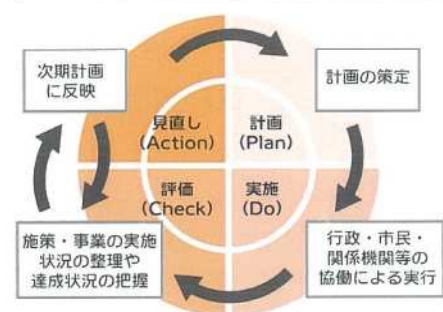
PDCAサイクルのイメージ図

第9期 東近江市高齢者保健福祉計画・介護保険事業計画 令和6年（2024年）3月