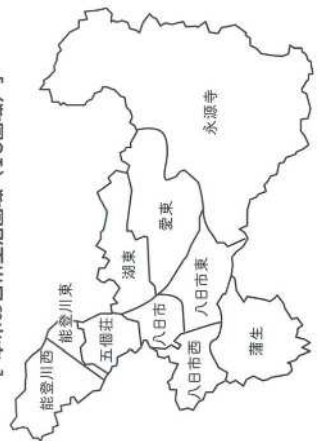
〔 本市の日常生活圏域（10圏域） 〕