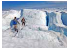
グリーンランド中西部の氷河調査

本市の暮らしの変化から、地球温暖化の影響が大きいといわれる北極の現状や課題についても紹介します。