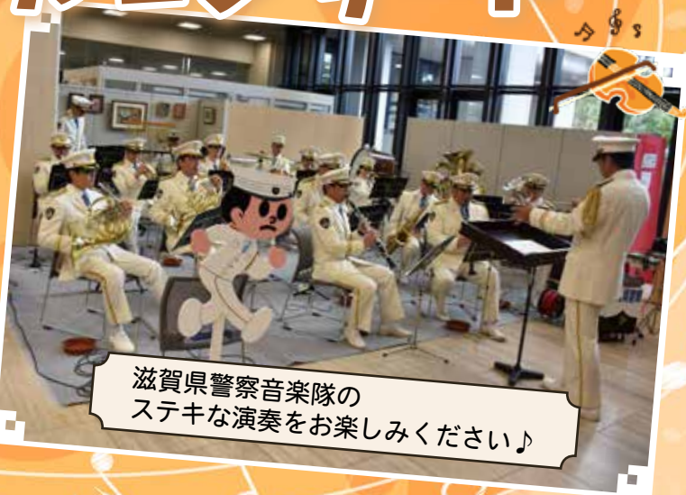
滋賀県警察音楽隊のステキな演奏をお楽しみください♪

公共建築百選に選ばれているすばらしい市役所本館(旧八日市市庁舎)で、ステキな音楽を聴きながら、お昼のひとつきを過ごしませんか。多くのご来場をお待ちしています♪